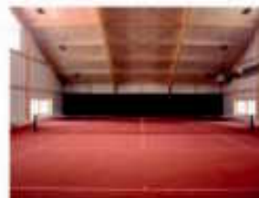
Halle de tennis

FARMWOOD - 1475 Forel - 026 663 97 11 WWW.FARMWOOD.CH